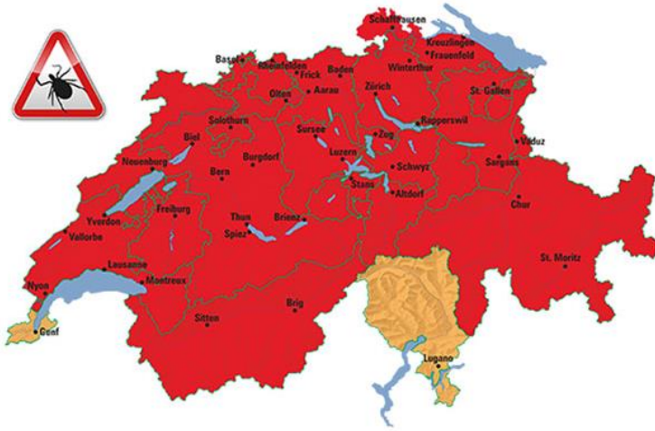
■ Borreliose Risikogebiete ■ FSME Risikogebiete (Diese Regionen sind ebenfalls Borreliose Risikogebiete)